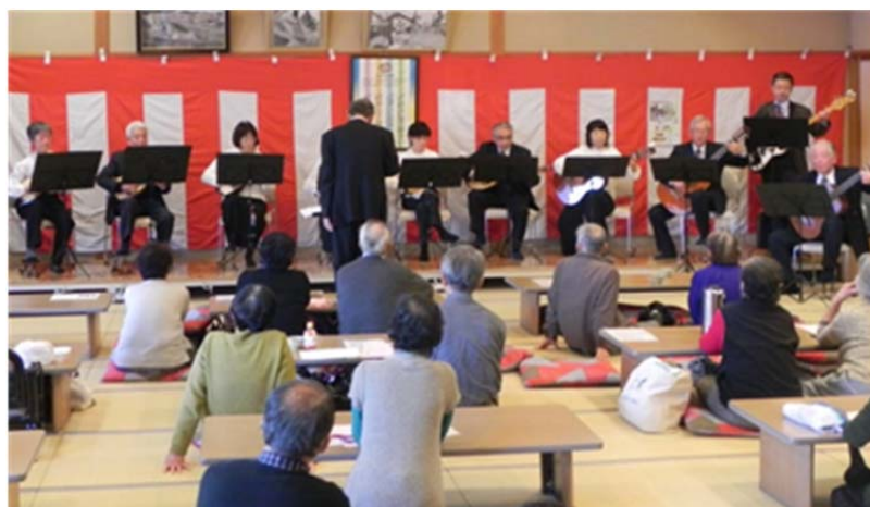
うつくしの湯コンサート

サートで、3月4日に行ないました。ここでは、コカリナ合奏団と男性合唱団と我々の3団体が出演し、持ち時間は45分間、我々は司会者、カメラマン含めて12名が参加し、下記の9曲を熱演しました。我々のコンサートはいつも“ごった煮”で、ラテン、童謡、歌謡曲、ポピュラー、セミクラシック、マンドリンオリジナルとマンドリン音楽