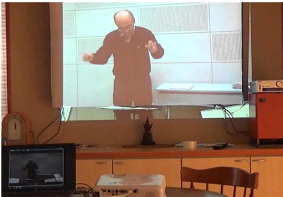
指揮ビデオをプロジェクタで映した様子