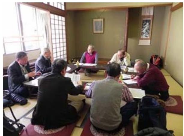
同窓会役員会の様子

今回の総会議題案は、記念祭及び人事案件含め今回の審議事項踏まえ、事前に5月に役員の皆様にお伝えします。