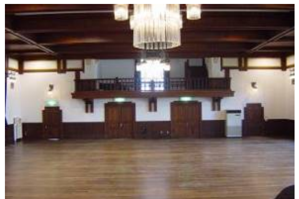
講堂内 200名収容、1922年築、ドイツ式木造建築、大正デモクラシーを代表する建築物、ひときわシャンデリアが輝きます。 国の重要文化財