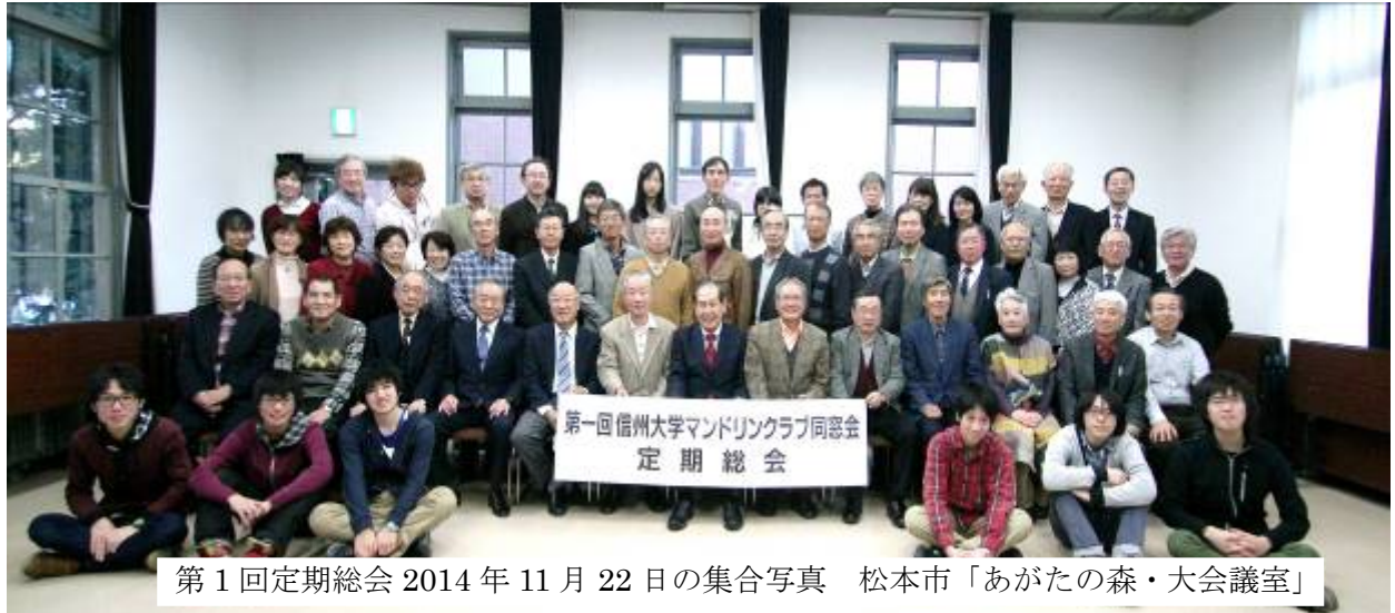
第1回定期総会 2014年11月22日の集合写真 松本市「あがたの森・大会議室」

長〜い冬もそろそろ終わり、うらかな春へ---、みなさん元気で活躍のことと存じます。 今年、2年に一度開催します定期総会。合奏したり、聴いたり、おしゃべりしたり、食べたり飲んだりしながら、楽しいひと時を過ごしたいと思います。みなさまの参加をお願いいたします。